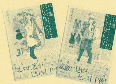
▲「パリ流 おしゃれアレンジ!」、「パリ流 おしゃれアレンジ!2」 著/米澤よう子 各1,260円・メディアファクトリー

「女性らしい体のラインに見せる服を選ぶ」「足し算より引き算」「定番服を小物や着崩しでアレンジ」など、使える情報が満載で、フランスと日本を歩きまわってきた著者が描くパリジェンヌのイラストも可愛い。パリジェンヌはもちろん、パリの魅力も再発見できますよ。