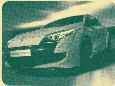
▲メガーヌ ルノースポール ・標準モデル (左ハンドル/6速マニュアル/18インチホイール):メーカー希望小売価格 3,850,000円(税込) ・注文生産モデル (左ハンドル/6速マニュアル/19インチホイール): メーカー希望小売価格 3,970,000円(税込)